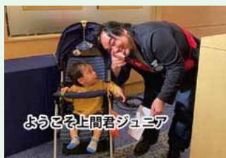
ようこそ上間君ジュニア